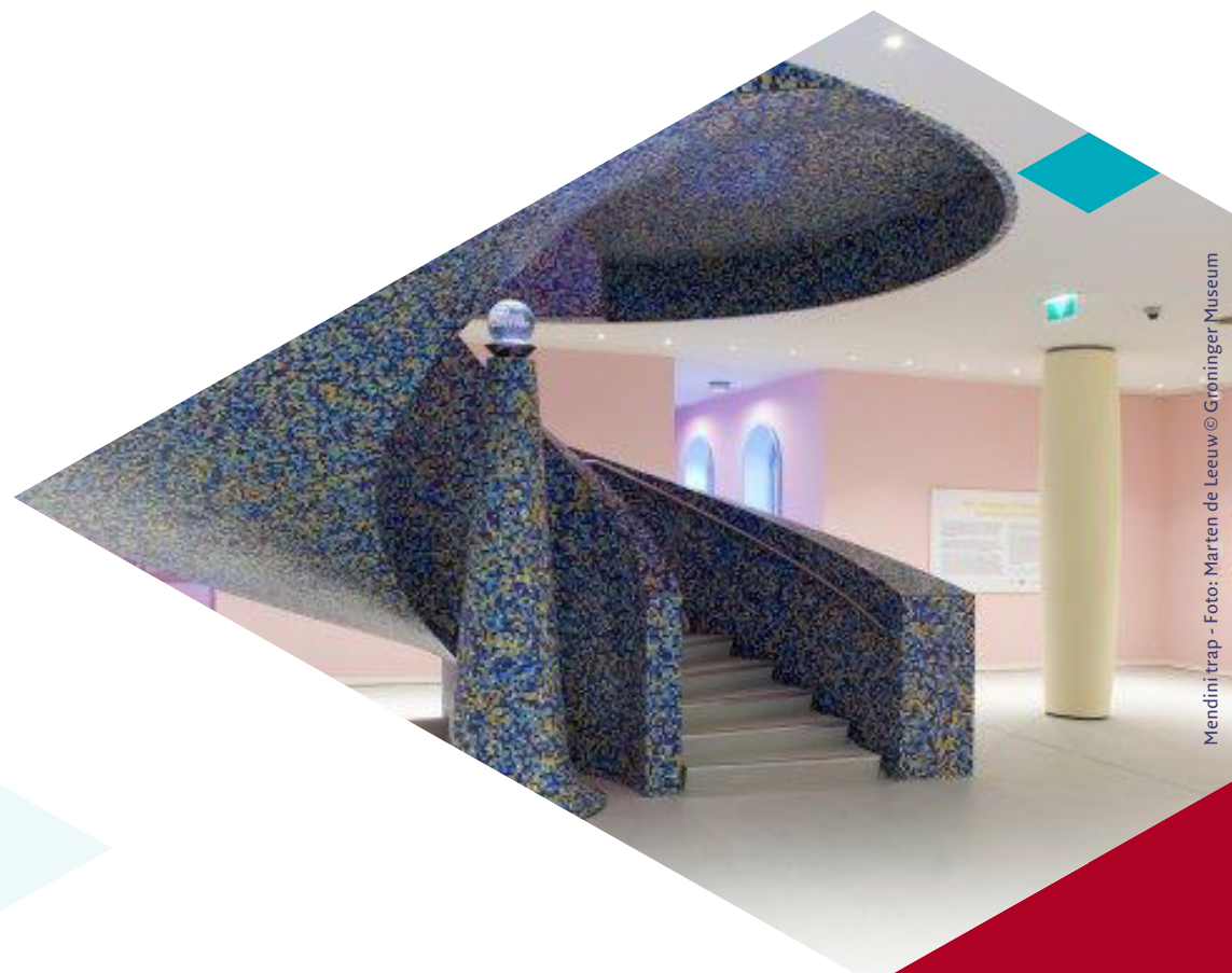
Mendini trap - Foto: Marten de Leeuw © Groninger Museum